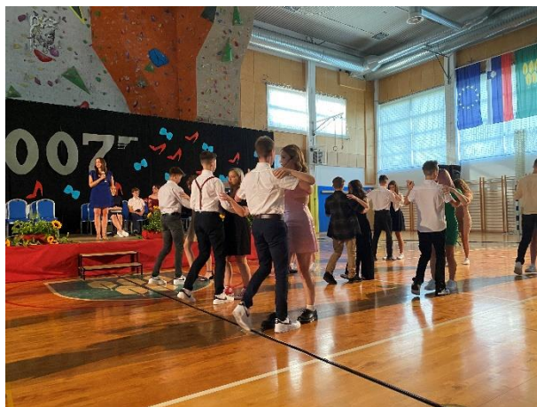
Valeta generacije 2007 (junij 2022)

Prašček: »Kako se črkuje beseda ljubezen?« Pu: »Ljubezen se ne črkuje ... ljubezen se občuti.«