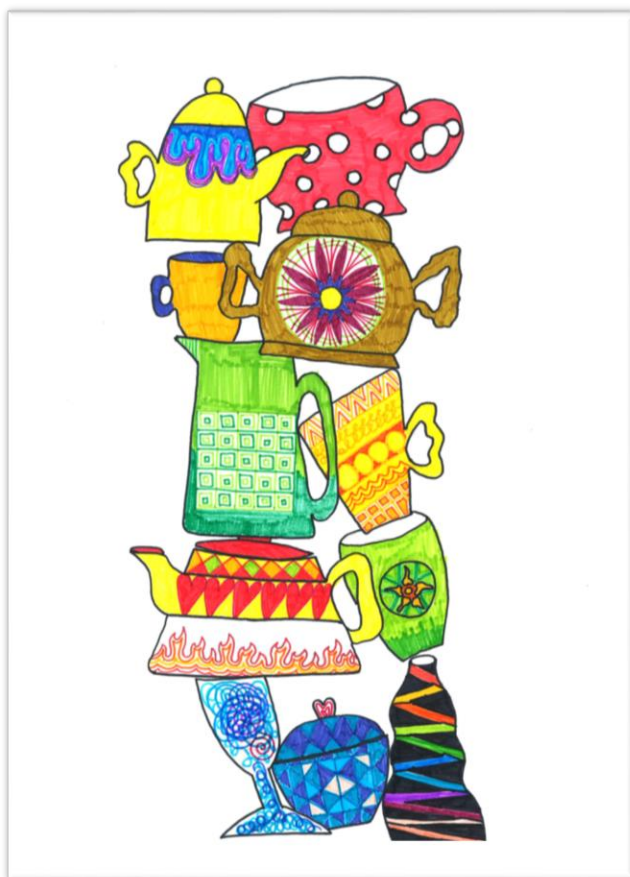
Ema Rus, 7. a

ustrezne pogoje za vzgojo in izobraževanje tako, da jim prilagodi vsebine, metode in oblike dela ter jim omogoči vključitev v dodatni pouk, druge oblike individualne in skupinske pomoči ter druge oblike dela.