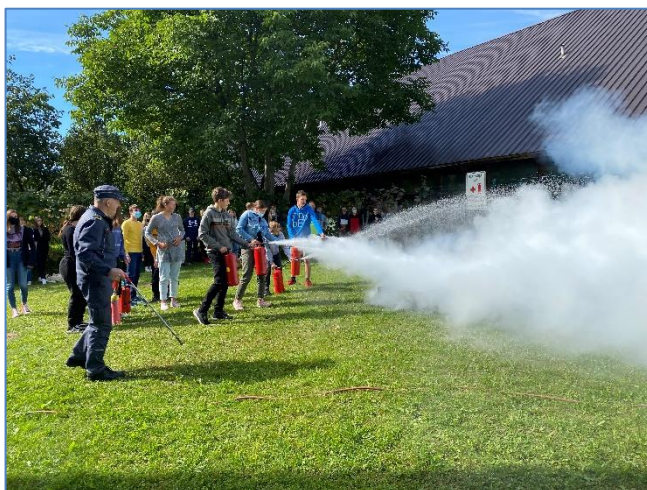
Gašenje (9. razred)