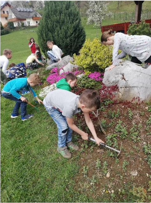
Urejanje šolskega vrta

»Če pride kdaj dan, ko ne bova več skupaj, me obdrži v srcu, tam bom ostal večno.«