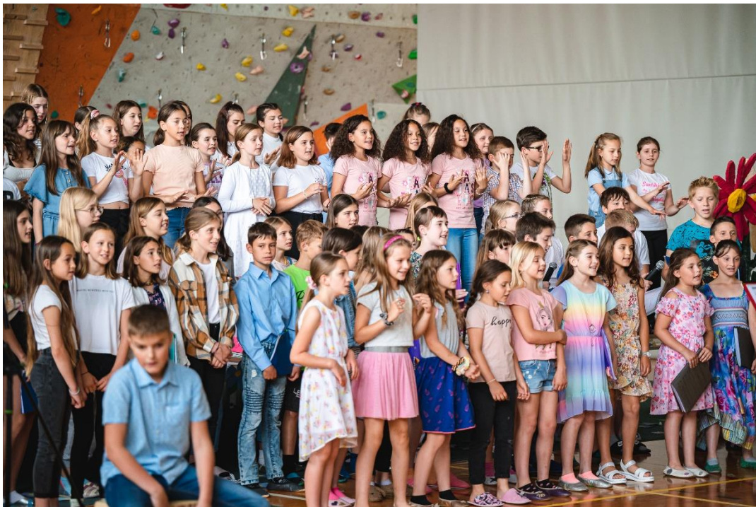
Zborovski BUM (junij 2022)