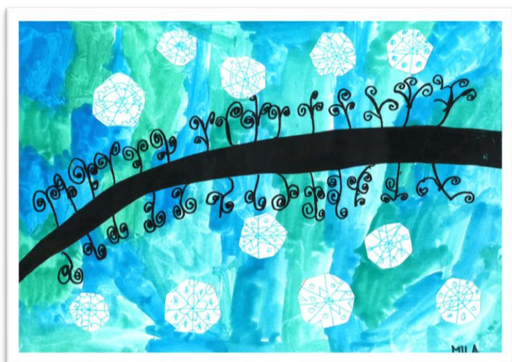
Mila Rekar, 1. b

V šolskem letu 2021/2022 smo po dveh letih ponovno izpeljali tekmovanje za naj razred šole. Učenci so se za naslov potegovali z dobrodelnimi dejavnostmi, branjem, športnimi in drugimi dosežki. Za nespoštovanje šolskih pravil pa so si lahko prislužili tudi negativne točke. V končnem seštevku sta naziv naj razred osvojila 4. b na razredni stopnji in 6. a na predmetni stopnji.