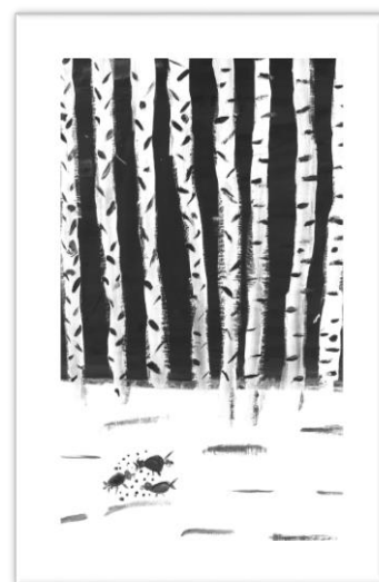
Leni Pirih, 3. b

»Obljubi mi, da si boš za vedno zapomnil, da si pogumnejši, kot verjameš, močnejši kot izgledaš in pametnejši kot misliš.«