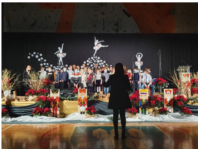
Dobrodelni koncert (december 2021)

Publikacija Šola, dober dan je povzetek letnega delovnega načrta, ki ga svet šole vsako leto sprejme in potrdi na redni seji konec meseca septembra. V publikaciji boste našli podatke o dosežkih naših učencev v preteklem letu in informacije o poteku novega šolskega leta.