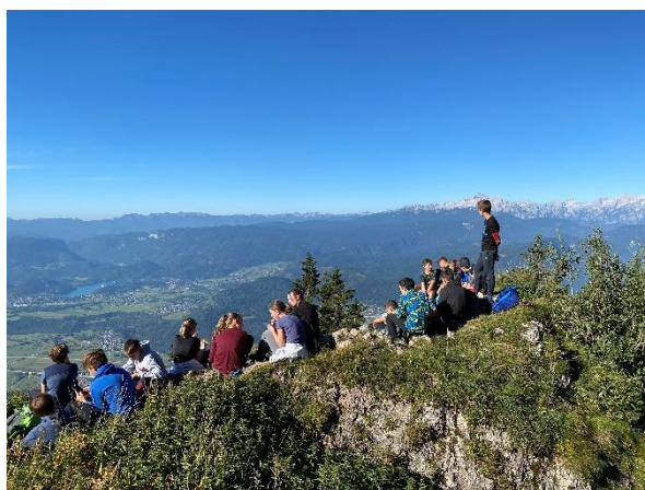
Pohod na Stol – 9. razred (september 2021)