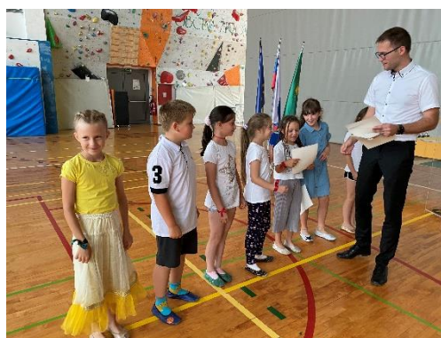
Podelitev priznanj učencem za dosežke na različnih področjih (junij 2022)