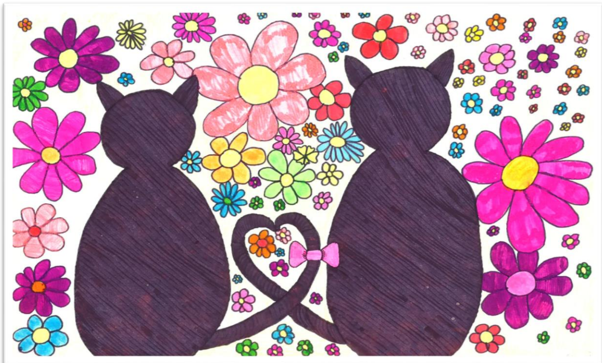
Žana Meglič, 4. b